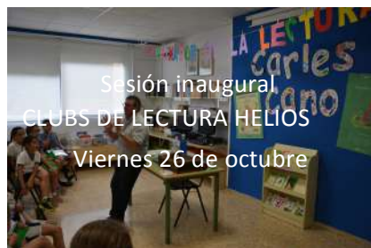
Sesión inaugural CLUBS DE LECTURA HELIOS Viernes 26 de octubre

El 2 de Octubre ESTRENO del servicio de PRÉSTAMO de la Biblioteca de Primaria. ¡Las BIBLIOTECARIAS os esperan los MARTES a las 12'20h. y los MIÉRCOLES a las 15'00h.!